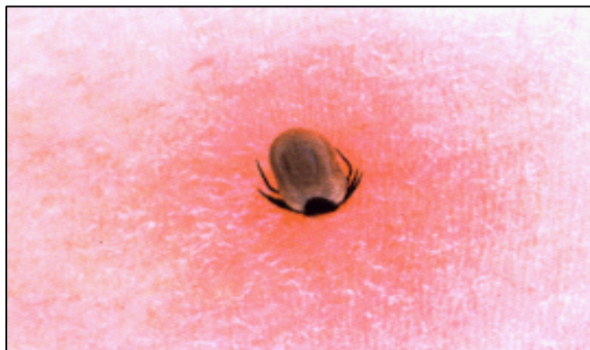
Une tique accrochée à la peau d'un homme

Les tiques sont des petits acariens de couleur brun-noir et de la taille d'une tête d'épingle. Elles se nourrissent de sang. Les tiques sont présentes dans les bois , dans les prairies et les espaces verts urbains . Elles se logent sur les animaux et les personnes qui passent tout près d'elles.