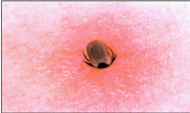
Zecke auf der Haut eines Mannes

Zecken sind kleine braun-schwarze Milben in der Größe eines Nadelkopfes. Sie ernähren sich von Blut und leben im Wald , in Wiesen sowie städtischen Grüngebieten auf. Sie heften sich an Tiere und Personen, die sich in ihrer Nähe aufhalten.